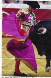
José Tomas, le janséniste de l'arène, l'incorruptible de la muleta. Canada.